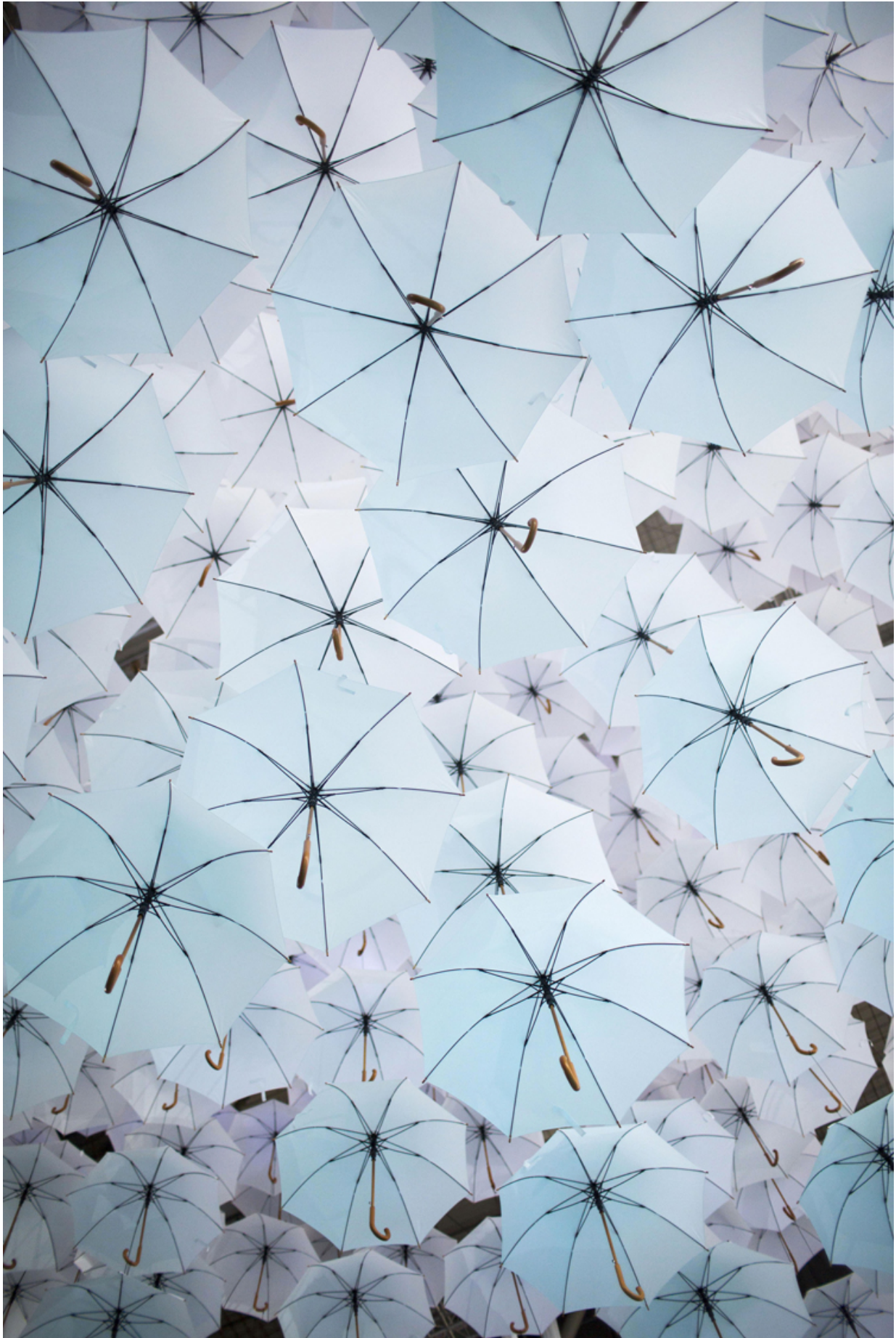
Kaisa & Timo Berry, 1100 floating umbrellas , 2015, installation